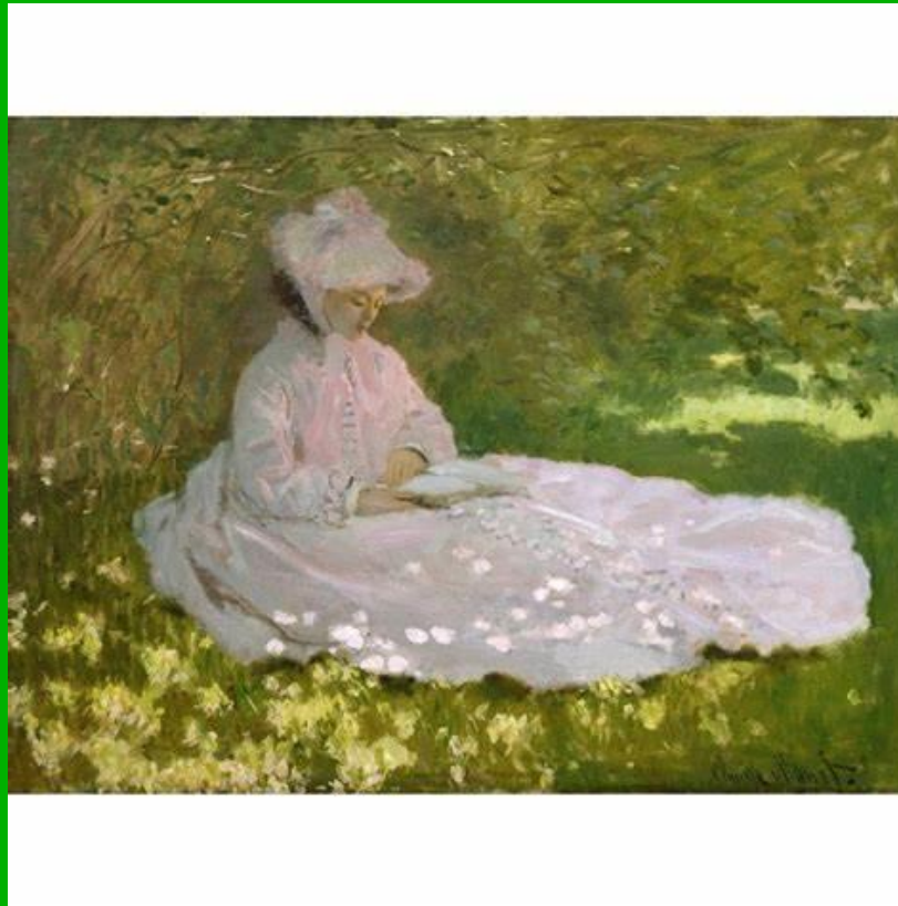
PRIMAVERA DI CLAUDE MONET