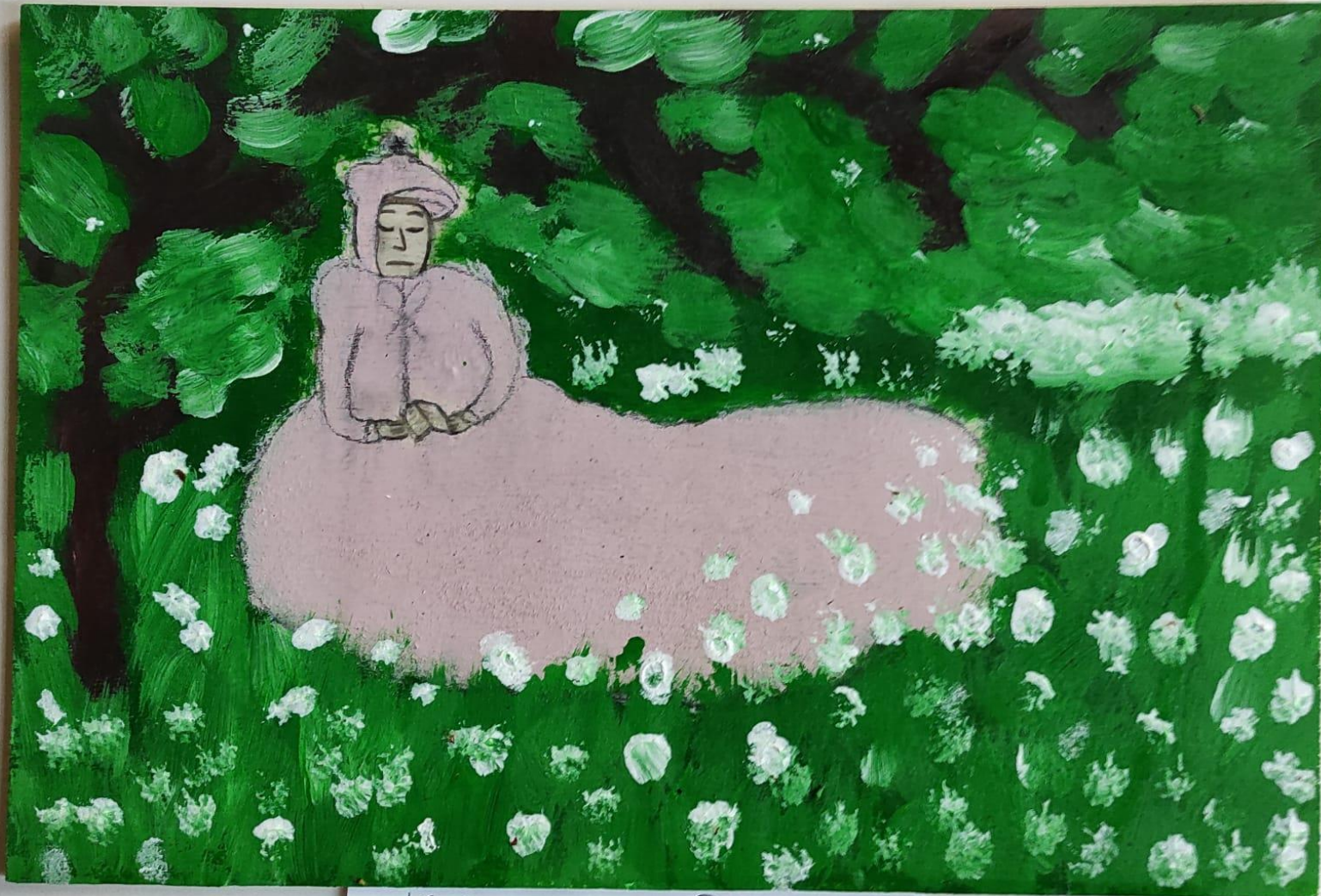
Kyle Moises Domingo