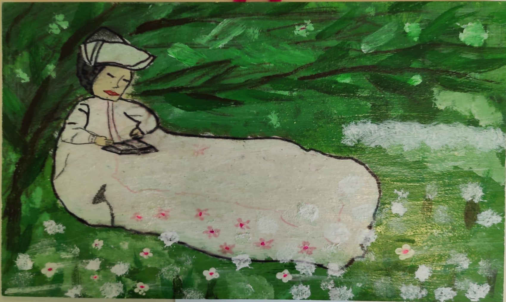
Louise Charles Grande