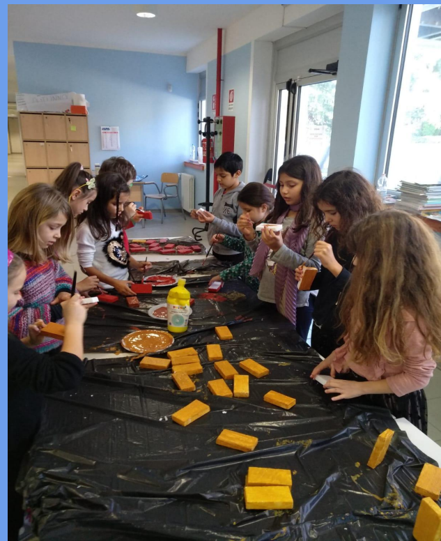
Insieme, hanno dipinto i mattoncini...