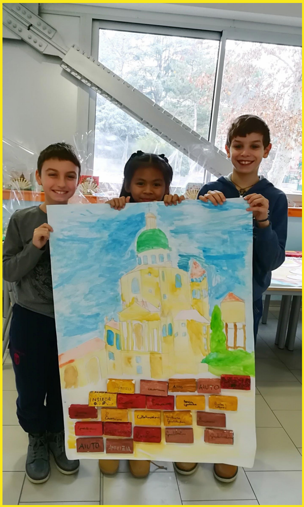
Hanno partecipato gli alunni e le docenti delle classi 2A, 3A e 3B, 4A e 4B della Scuola primaria " S. Ferrari"